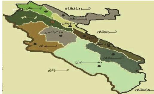
شکل شماره ۱. نقشه استان ایلام

ابتدا پایه فلزی در محل قرار می گرفت و سپس دستگاه به طوری که میله های جلوی پنجره ورودی را نگیرند به صورت افقی قرار داده شد.