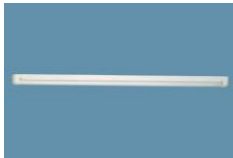
شکل 2- طرح شماتیک و بلان موقعیت لامپ ها (لامپ مهتابی 36 وات ساخت شرکت osram) در طراحی سیستم روشنایی سالن مطالعه به ابعاد 3×6 متر