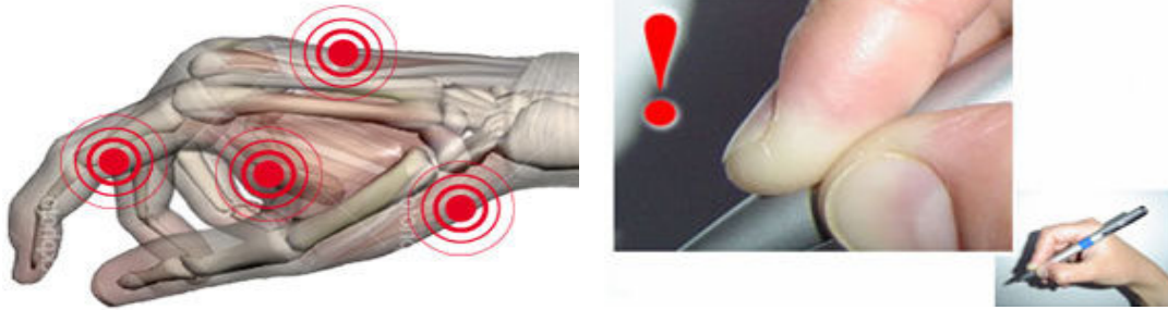
شکل شماره ۳. در استفاده از خودکارهای معمول و رایج، نقاطی که با دایره های تیره مشخص شده اند دچار ناراحتی و آسیب می شوند

انگشت شست، انگشت اشاره و دو انگشت میانی بوده که معمولاً در هنگام خواب بروز می کند.(۹،۱۰) CTS در بسیاری از مشاغل از جمله در میان کارگران بسته بندی، کارگران صنایع خودرو سازی، ماشین نویسان و افرادی از قبیل تحویلداران و منشی ها که به مدت طولانی مشغول به نوشتن هستند