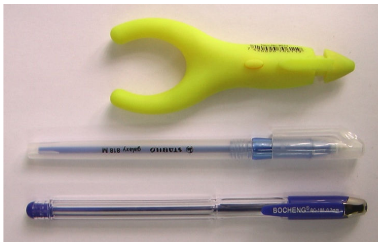
شکل ۱ - خودکارهای Penagain (ارگونومیک)، Stabilo و Bocheng (غیر ارگونومیک)