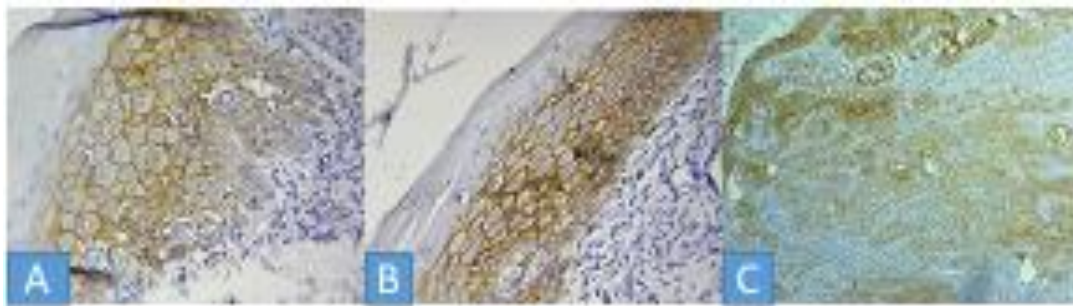
شکل شماره ۲. رنگ آمیزی ایمونوهیستوشیمی E-cadherin در گروه‌های مطالعه‌شده؛ بیان E-cadherin در لیکن پلان با بزرگ‌نمایی 10\times (A)، در لکوپلاکیا (B) و در اسکواموس سل کارسینوما (C)

در زمینه وسعت رنگ‌پذیری نمونه‌های SCC، لکوپلاکیا و لیکن پلان برای بیان مارکر E-cadherin یافته‌ها نشان داد وسعت رنگ‌پذیری در نمونه‌های SCC در ۱۰ درصد نمونه‌ها در وسعت بیشتر از ۷۵ درصد و در لکوپلاکیا و لیکن پلان به ترتیب ۶۰ درصد و ۵۰ درصد رنگ‌پذیری نشان دادند. نتایج آزمون دقیق فیشر برای بررسی درصد سلول‌های رنگ‌گرفته (وسعت رنگ‌پذیری) در سه گروه (SCC، لکوپلاکیا و لیکن