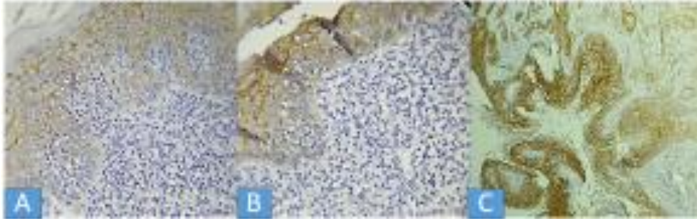
شکل شماره ۱. رنگ آمیزی ایمونوهیستوشیمی CD44 در گروه‌های مطالعه‌شده؛ بیان CD44 در لیکن پلان با بزرگ‌نمایی 10\times (A)، در لکوپلاکیا (B) و در اسکواموس سل کارسینوما (C)

پلان) اختلاف آماری معنی‌داری را نشان داد ( P=0.006 ) (شکل شماره ۲).