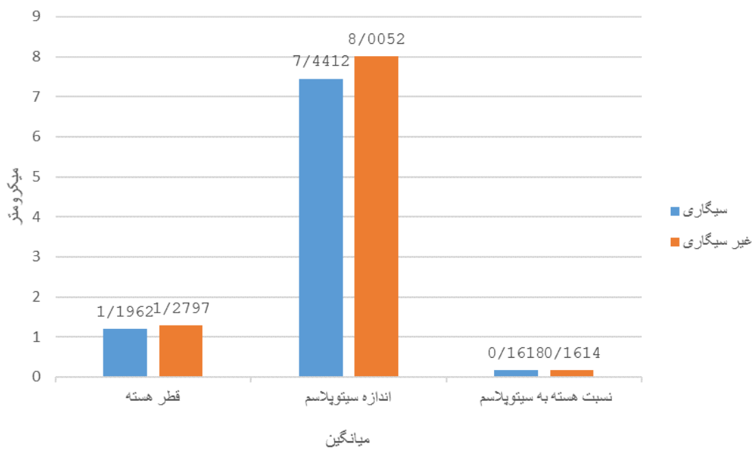
شکل شماره ۳. میانگین مؤلفه های مرفومتریک گروه سیگاری و غیرسیگاری در رنگ آمیزی پاپانیکولاو