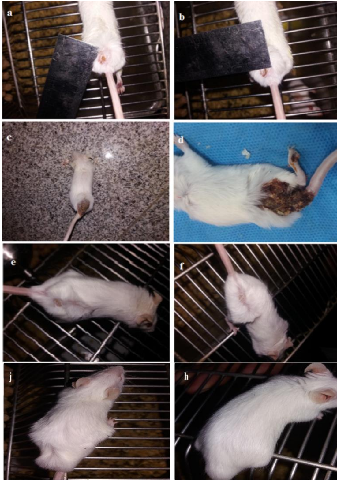
شکل شماره ۱. تصاویر مربوط به ایجاد زخم لیشمانیوز در گروه کنترل و تحت درمان؛ تصویر a و b. طول و عرض زخم ناشی از لیشمانیا ماژور در هفته دوم پس از ایجاد زخم؛ تصویر c. زخم ناشی از لیشمانیا ماژور در هفته چهارم پس از ایجاد زخم در گروه کنترل؛ تصویر d. زخم ناشی از لیشمانیا ماژور در پایان هفته پنجم پس از ایجاد زخم در گروه کنترل؛ تصویر e. زخم ناشی از لیشمانیا ماژور در هفته چهارم پس از ایجاد زخم در گروه تحت درمان با نانوذرات حاوی پپتید؛ تصویر f. زخم ناشی از لیشمانیا ماژور در هفته پنجم پس از ایجاد زخم در گروه تحت درمان با نانوذرات حاوی پپتید؛ تصویر g. زخم ناشی از لیشمانیا ماژور در هفته چهارم پس از ایجاد زخم در گروه تحت درمان با لیپوزوم حاوی پپتید؛ تصویر h. زخم ناشی از لیشمانیا ماژور در هفته پنجم پس از ایجاد زخم در گروه تحت درمان با لیپوزوم حاوی پپتید.