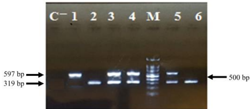
شکل ۲. الکتروفورز محصولات PCR قطعه‌ای از ژن ACE. ستون‌های ۲ و ۶: ژنوتیپ DD به طول ۳۱۹ bp؛ ستون‌های ۳، ۴ و ۵: ژنوتیپ ID حاوی دو باند به اندازه‌های ۳۱۹ bp و ۵۹۷ bp و ستون ۱: ژنوتیپ I/I حاوی یک باند به اندازه ۵۹۷ bp. نمونه C- نمونه فاقد Template بود و مارکر (M)، ۱۰۰ bp DNA ladder. (شرکت یکتا تجهیز) است.

و (۵۸/۳ درصد) و هم گروه غیرورزشکاران (۶۵/۱ درصد) و در نهایت، در کل جمعیت مطالعه شده (۶۲/۳ درصد) بالاتر بود. تجزیه و تحلیل داده‌ها نشان داد که هیچ‌یک از آلل‌های چندشکلی Ins/Del ژن ACE با استعداد وزنه‌برداری به لحاظ آماری ارتباط معنادار ندارد (P=0.406). (جدول شماره ۲). همچنین در توزیع ژنوتیپینگ، D/I هم در جمعیت مورد مطالعه (۵۰/۷ درصد) و هم در دو گروه وزنه‌برداران (۵۶/۷ درصد) و غیرورزشکاران (۴۶/۵ درصد) شایع‌ترین بود؛ اما نتایج آزمون کای مربع نشان داد که اختلاف معناداری در توزیع ژنوتیپینگ ACE D/I در گروه وزنه‌برداران نخبه با غیرورزشکاران وجود نداشت ( \chi^2=0.31 ) (جدول شماره ۳).