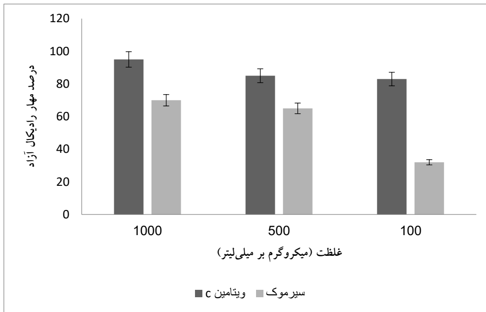
شکل شماره ۱. مقایسه آنتی‌اکسیدان عصاره سیرموک و ویتامین C

بیشترین فعالیت آنزیم 1\text{-min-}1\text{-}\mu\text{l-}1\text{-}168/97 در حضور غلظت ۱ میلی‌گرم بر میلی‌لیتر مشاهده شد و تفاوت معناداری نسبت به کنترل نشان داد. مقدار P < 0.05 در نظر گرفته شد (جدول شماره ۱). درصد فعال‌سازی فعالیت آنزیم با غلظت رابطه مستقیم داشت؛ هرچه غلظت افزایش یابد، درصد فعال‌سازی افزایش پیدا می‌کند (جدول شماره ۲). در زمان مهار آنزیم توسط دیازینون، فعالیت آنزیم 1\text{-min-}1\text{-}\mu\text{l-}1\text{-}39/21 \pm 3/20 محاسبه شد، به طوری که فعالیت آنزیم ۷۰ درصد کاهش یافت. فعال‌سازی دوباره آنزیم استیل کولین‌استراز مهارشده در حضور غلظت‌های مختلف عصاره آبی گیاه سیرموک مشاهده گردید. میزان بازیابی فعالیت آنزیم تابع غلظت بود، به طوری که در غلظت ۱۰۰۰ میکروگرم بر میلی‌لیتر عصاره، تفاوت معناداری نسبت به غلظت‌های پایین‌تر وجود داشت (شکل شماره ۲).