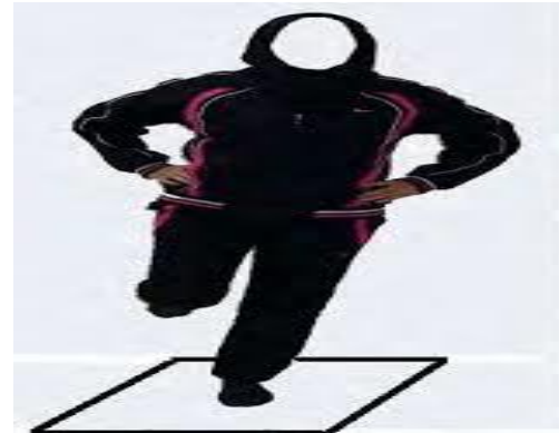
شکل شماره ۳: آزمون ایستادن لگ لک

ابتدا اطلاعات دموگرافیک افراد مبتلا به ام‌اس با استفاده از شاخص‌های آمار توصیفی مانند میانگین و انحراف استاندارد توصیف گردید (جدول شماره ۳). با توجه به نتایج آزمون کولموگروف اسمیرنوف در جدول شماره ۳، دو گروه TRX و ایروفتنس تحقیق اختلاف معناداری در متغیرهای سن، قد و وزن نداشتند؛ همچنین آزمون لون پیش‌فرض تساوی واریانس نمرات آزمودنی‌ها در همه متغیرهای تحقیق در مرحله پیش‌آزمون را نشان داد ( P \geq 0.05 )؛ بنابراین،