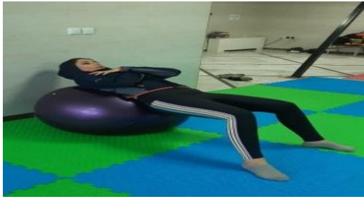
شکل شماره ۲. تمرین ایروفتنس

شکم، مورب شکمی و مولتی فیدوس بود (۱۸) (شکل شماره ۲ و جدول شماره ۲).