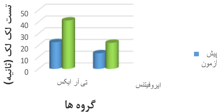
شکل شماره ۵. درصد تغییرات آزمون تعادل لک‌لک از پیش آزمون تا پس آزمون در گروه‌های تحقیق