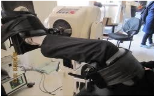
شکل شماره ۴: دستگاه ایزوکنتیک با یو د کس

برای تجزیه و تحلیل داده‌ها از نرم‌افزار SPSS vol.22 و آمار توصیفی (میانگین و انحراف معیار) به ترتیب به عنوان شاخص‌های گرایش مرکزی، پراکندگی و در آمار استنباطی از آزمون‌های تی همبسته برای مقایسه درون‌گروهی و تی مستقل برای مقایسه بین‌گروهی با سطح معناداری ( P \geq 0.05 ) استفاده گردید؛ همچنین از آزمون کولموگروف اسمیرنوف و آزمون لون به ترتیب برای بررسی نرمالیته بودن داده‌ها و برابری واریانس‌ها استفاده شد.