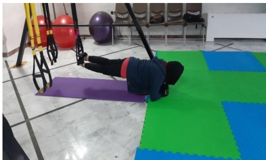
شکل شماره ۱. تمرین TRX

پروتکل تمرینات عملکردی ایروپیتنس: ایروپیتنس تمریناتی ترکیبی از ایروبیک و فیتنس است. این تمرینات اغلب با وزنه‌های کوچک انجام می‌شود و با بدن‌سازی با وزنه‌های سنگین و قدرتی بسیار تفاوت دارد. این ورزش علاوه بر عضله‌سازی، باعث افزایش قدرت، استقامت و تحرک می‌شود. تمرینات با استفاده از توپ ورزشی،