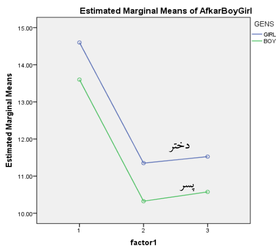
نمودار ۱. میزان افکار خودکشی اقدام کننده به خودکشی در استان ایلام در وضعیت های آزمون در میان پسران و دختران