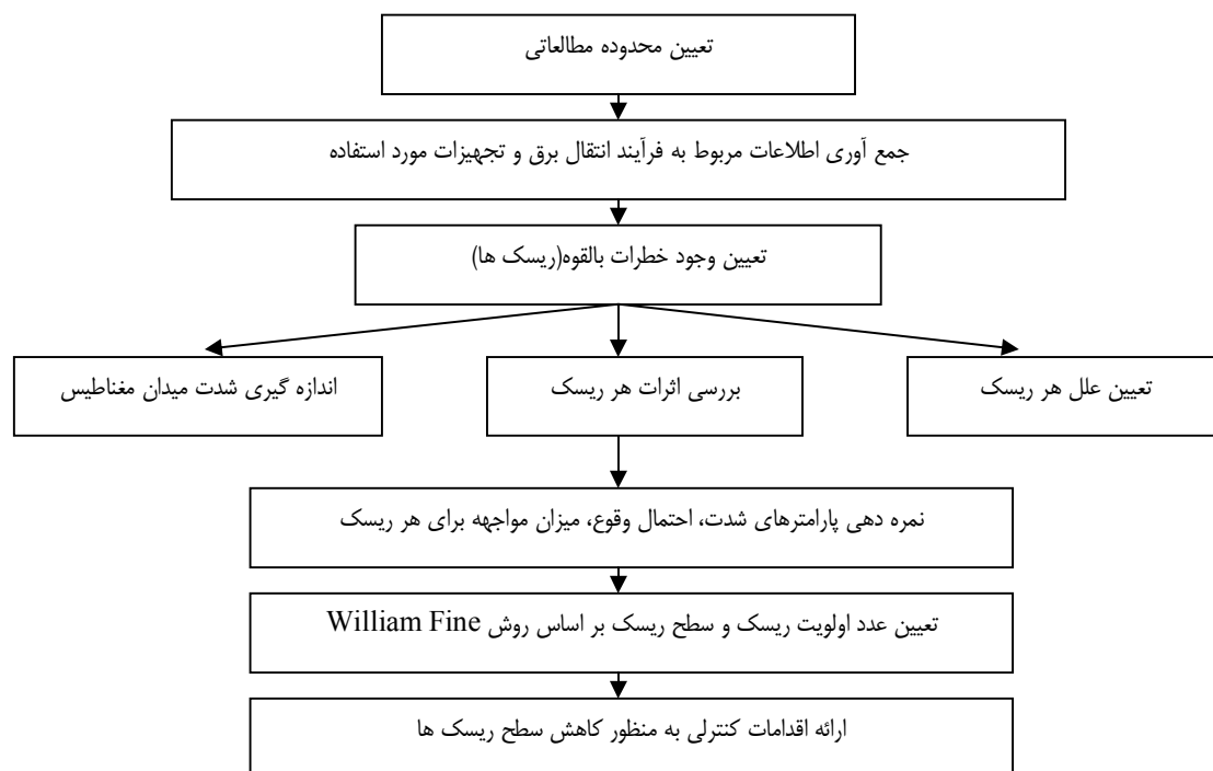
نمودار شماره ۱. مراحل انجام ارزیابی ریسک خطوط انتقال برق منطقه حصیرآباد اهواز

در این تحقیق، ابتدا محدوده مورد مطالعه تعیین و شدت میدان مغناطیس ساطع شده از دکل برق فشار قوی در محدوده مورد نظر اندازه گیری شد. پس از آن ریسک