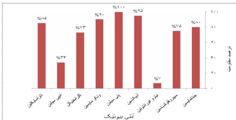
نمودار شماره 1. درصد مقاومت آنتی بیوتیکی سویه های انتروکوک ایزوله شده از بیماران

تعیین الگوی حساسیت ایزوله های انتروکوک نسبت به دیسک های آنتی بیوتیکی، نشان داد که میزان مقاومت به تتراسایکلین 85 درصد، آمپی سیلین 34 درصد، کلرامفنیکل 73 درصد، ونکومایسین 90 درصد، پنی سیلین 100 درصد، آمیکاسین 95 درصد، نیتروفوراتوئین 7 درصد، سیپروفلوکساسین 75 درصد، جنتامایسین 80 درصد بود. (نمودار شماره 1) بنا بر این بیشترین مقاومت نسبت