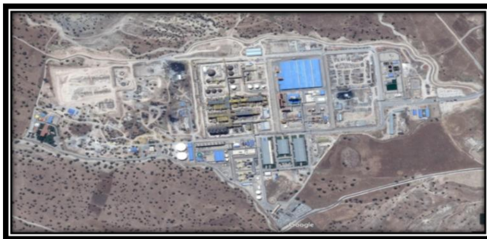
شکل شماره ۱. تصویر ماهواره ای مجتمع پتروشیمی ایلام

پتروشیمی ایلام شامل یک واحد الیفین با تولید اتیلن، پروپیلن، بنزینپیرولیز، برش های چهار کربنه و سوخت مایع به ترتب با ظرفیت ۴۵۰، ۱۲۰، ۱۴۰، ۸۵ و ۹/۵ هزار تن در سال می باشد. کل محصول اتیلن تولید شده مجتمع به عنوان خوراک واحد پلی اتیلن جهت تولید پلی اتیلن سنگین به مصرف می رسد(شکل شماره ۱).