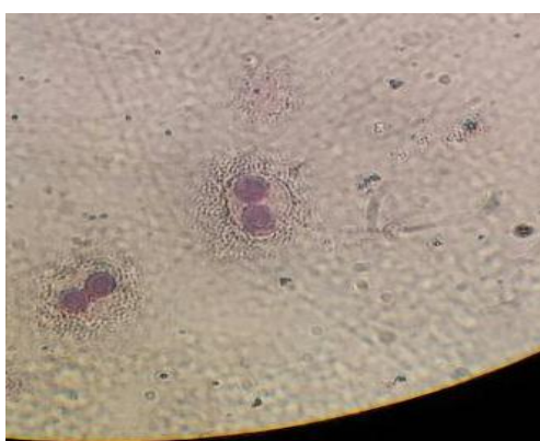
شکل شماره ۱. یک سلول دوهسته ای سالم (بدون ریزهسته)

لئوسیت ها، محصول برداری صورت گرفت (۱۷). محتویات ظروف کشت به مدت ۸ دقیقه با دور ۸۰۰ rpm سانتریفوژ گردید. بعد مایع فوقانی به آرامی خارج شده و به محتویات ته لوله، ۶ میلی لیتر محلول هیپوتونیک پتاسیم کلراید افزوده شد و بلافاصله نمونه ها با دور ۱۰۰۰ rpm به مدت ۵ دقیقه سانتریفوژ شدند. سپس مایع فوقانی برداشته شده و برای ثابت کردن سلول ها، محلول ثابت کننده شامل یک قسمت اسیداستیک گلاسیال و ۶ قسمت متانول به نمونه ها سانتریفوژ شد و این عمل به صورت پیاپی (حداقل ۳ بار)