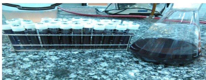
شکل شماره ۱. تلقیح باکتری ها در محیط کشت نوترینت براث حاوی رنگ روبین دیپرسی

استفاده از این روش کار، مبتنی بر روش کار و نتایج مثبت کسب شده در پژوهش های انجام شده توسط نوحی و همکاران در سال ۱۳۸۷ که ۱۰۰ درصد رنگ زدایی توسط سویه های جداسازی شده بومی مشاهده شد، بود (شکل شماره ۱).