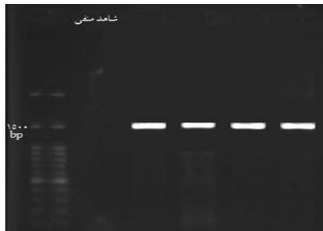
شکل شماره ۱. نقوش الکتروفورزی محصول PCR در ژل آگارز ۱/۲ درصد

ع-آنالیز داده های نوکلئوتیدی: پس از اطمینان از صحت انجام PCR و عدم وجود آلودگی از طریق الکتروفورز محصولات، محصول PCR جهت تعیین توالی به همراه آغازگرهای رفت و برگشت به شرکت ماکروژن کره جنوبی (توسط شرکت تکاپو زیست) ارسال گردید. به کمک توالی دو رشته رفت و برگشت و با استفاده از نرم افزار BioEdit Sequence Alignment Editor v.7.0.9.0 تطبیق توالی های 16S rDNA انجام پذیرفت (۱۳)، سپس توالی به دست آمده در سایت NCBI، با سایر توالی های سویه های استاندارد موجود