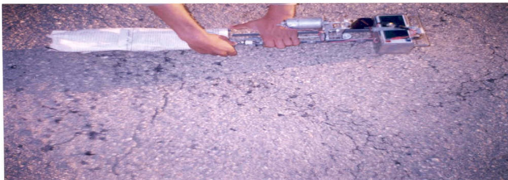
شکل ۳: آماده‌سازي براي استريل کردن قطعه پايين رونده