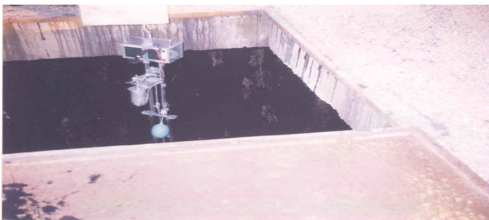
شکل ۴: نحوه استقرار دستگاه بر روي مخازن آب