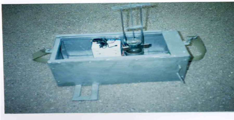
شکل ۵: نحوه جداسازي بطري نمونه‌برداري از قطعه پايين رونده