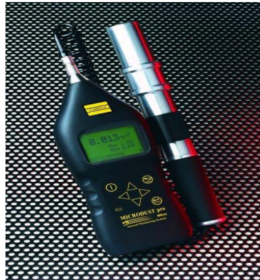
شکل ۱: Casella's. Microdust pro Particulate Monitor

استفاده شد (شکل ۱) که قادر است تراکم کل ذرات معلق گرد و غبار (TSP) در غلظت های بین 1\mu\text{g}/\text{m}^3 تا 2500\text{mg}/\text{m}^3 را مشخص کند.