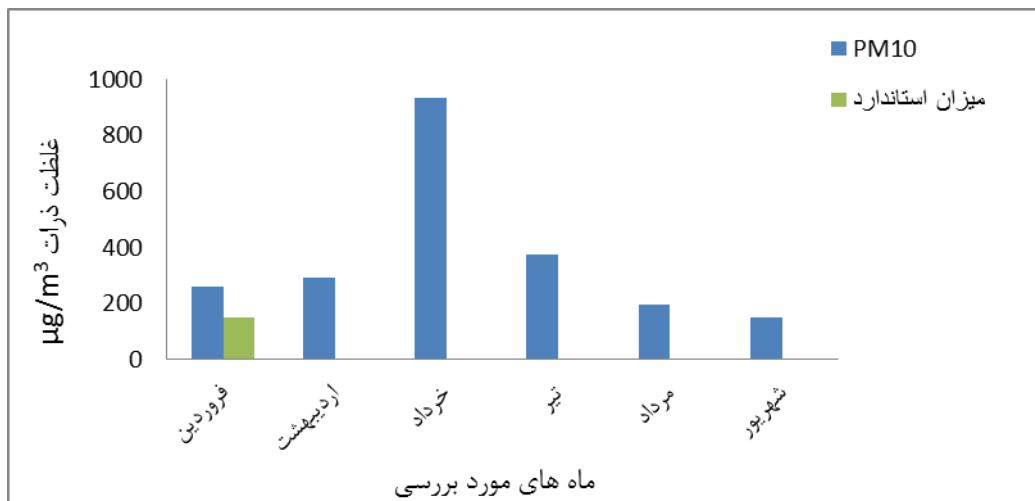
نمودار ۱. کیفیت هوای شهر ایلام از نظر وجود ذرات PM 10 براساس ماه های مورد بررسی (رنج استاندارد <math>150 \mu\text{g}/\text{m}^3</math>)

ماهه اول سال مورد بررسی قرار گرفت و مشخص شد که کم ترین توان دید افقی در تیر ماه با میزان ۶/۷ کیلو متر و بیش ترین توان دید افقی در شهریور ماه با میزان ۹/۵ کیلو متر بوده است. هم چنین در بررسی که بروی بار میکروبی گرد و غبار صورت گرفت جمعیت قارچ های غالب عبارت بودند از: آسپرژیلوس نایجر، پنی سیلیوم و موکور و جمعیت باکتری های غالب شامل: استاف اورئوس و باسیل گرم مثبت و کوکسی گرم منفی بود که توصیف تعداد کلنی ها و مقادیر آن ها به دو روش نمونه برداری با فیلتر و نمونه برداری به روش پلیت باز در جداول شماره ۴ و ۵ آورده شده است.