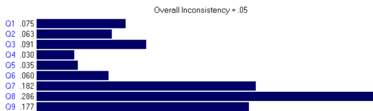
شکل شماره ۱. رابطه بین بخش و مولفه های مورد مطالعه

ارتقای شغلی بیشتر رابطه را داشت و تاثیر نوع بخش بر این سه عامل در رضایت کارکنان مورد مطالعه بیشترین تاثیر را داشت.