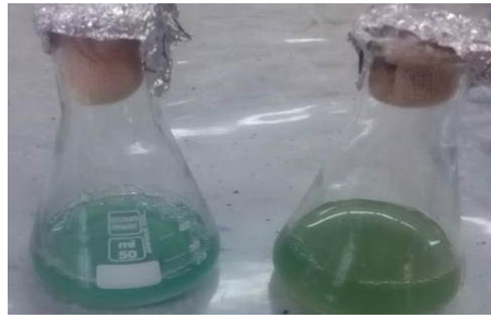
شکل شماره ۲. تولید پیگمان توسط باکتری سودوموناس آئروجینوزا در محیط GA قبل از استخراج پیگمان

جدول شماره ۲. تولید پیگمان در جدایه های بالینی سودوموناس آئروجینوزا بر اساس جذب نوری ( OD_{520} ) در حضور غلظت های مختلف نانوذرات اکسیدروی (اعداد میانگین جذب نوری را پس از سه بار تکرار نشان می دهند)