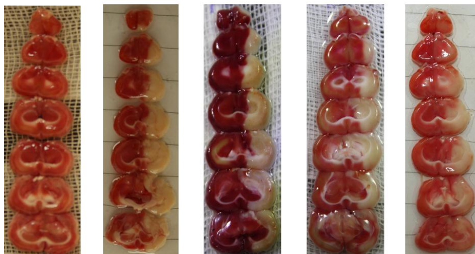
گروه دوز ۱۰۰ گروه دوز ۷۵ گروه دوز ۵۰ گروه کنترل گروه شم

تصویر شماره ۲: اثر دوزهای مختلف عصاره ی آبی تمبر هندی بر حجم سکنه مغزی