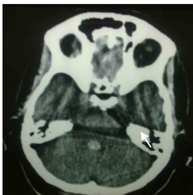
تصویر شماره ۱. سی تی اسکن از مغز بیمار

در بدو مراجعه علائم حیاتی بیمار نرمال بود و کمی از سردرد مبهم شکایت داشت. سرگیجه وی همراه با تهوع و استفراغ بود که با دراز کشیدن مختصری بهبود می یافت. در معاینه انجام شده ضعف محیطی عصب ۷ در سمت راست صورت به همراه اختلال در نگاه مشترک چشم ها به سمت راست وجود داشت. هم چنین کاهش حس سمت راست صورت در معاینه آشکار شد. در معاینه سایر اعصاب کرانیال و سیستم حسی-حرکتی-تعادلی وجود نداشت. با توجه به دسترسی بهتر و سهولت انجام توموگرافی کامپیوتری (سی تی اسکن)، بیمار ابتدا تحت سی تی اسکن بدون تزریق مغز از نظر وجود ضایعه در ناحیه پل مغزی قرار گرفت و در سی تی اسکن ایشان یک ناحیه هایپرندنس تنها در یک مقطع سی تی اسکن، در ناحیه بطن چهارم و در مجاورت پل مغزی دیده شد، اما در بقیه نواحی مغز شواهدی به نفع ضایعه مشهود نبود(تصویر شماره ۱).