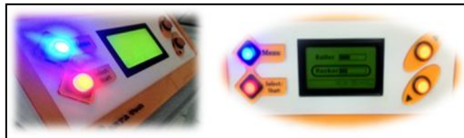
تصویر شماره ۲. نمایی از پنل کنترلی دستگاه

می شود و بعد از رسیدن به نقطه مورد نظر و سنس آهنربا دستگاه در زاویه مورد نظر می ایستد، این سیستم طراحی شده که خون آلوده به در لوله نرسد و آن ها آلوده نشوند، قابل ذکر است این آلودگی بعضی مواقع برای اپراتور خطرناک است.(تصویر شماره ۲)