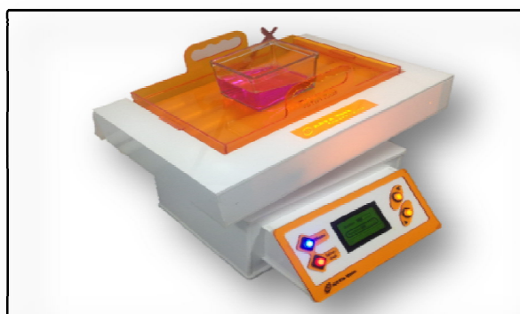
تصویر شماره ۳. نمایی از دستگاه در هنگام عملیات تخلیط

یا در مثالی دیگر مواد آزمایشگاهی باید در داخل ظرف های مخصوص به صورت الکلنگی و در سطح بالایی مایع میکس شوند، که در قسمت راکر دستگاه این امر صورت