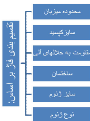
تصویر شماره ۲. تقسیم بندی فاژها بر اساس محتوای ژنومی و ساختمانی و سایز کپسید

و باعث از بین رفتن میزبان گردند، (۱۰). به دلیل این که اکثر فاژها دارای میزبان اختصاصی خود می باشند می توان از آن ها برای شناسایی و تعیین گونه و سوش باکتری به طور اختصاصی استفاده کرد که به این روش فاژتایپینگ phage typing گفته می شود. (۱۱، ۱۲)