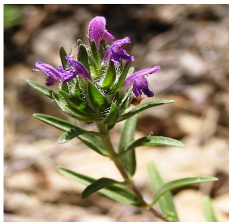
شکل شماره ۱. گیاه تیمبرای اسپیکاتا جمع آوری شده از ایلام

نتایج حاصل از آزمایش های فوق نشان داد که میزان IC50 در غلظت ۱۱۰ میکروگرم بر میلی لیتر در ۲۴ ساعت دیده شد. آنالیز آماری نتایج نشان داد که در زمان انکوباسیون ۲۴ ساعته، درصد مرگ سلولی با افزایش دوز عصاره هیدروالکلی تیمبرای افزایش یافته بود. هم چنان که در شکل شماره ۲ مشاهده می شود. افزایش درصد مرگ سلولی وابسته به دوز، در انکوباسیون ۴۸ ساعته نیز دیده شد و این میزان در مقایسه با زمان ۲۴ ساعت انکوباسیون سلول ها افزایش داشت، ولی این افزایش از نظر آماری معنی دار نبود. نتایج انکوباسیون ۷۲ ساعته نیز به همین صورت بود. هم چنین آزمایش ها نشان دادند که با کاهش غلظت، تاثیر ضدسرطانی عصاره تیمبرای کاهش می یابد. ( P < 0.05 ) به عنوان اختلاف معنی دار در نظر گرفته شد. درصد و نمودار سایتوتوکسیته پس از ۲۴ ساعت در ثبت و طراحی شد. هم چنین نتایج آزمون استخراج DNA و مقایسه آن با نتایج سلول کنترل نشان داد که شکستی در DNA سلول های سرطانی اتفاق نیفتاده است. (شکل شماره ۳)