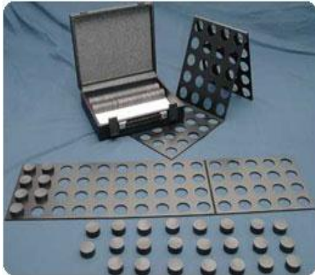
تصویر شماره ۱. Minnesota Manual Dexterity Test

کافی جهت ایجاد ثبات مورد نیاز، برای انجام فعالیت های زبردستی برخوردار باشند(۱۶)، و به همین دلیل در این تحقیق تقویت این دو عضله مدنظر می باشد. قدرت عضلات اکستانسور و ابداکتور مفصل شانه توسط Manual Muscle Test قبل و بعد از مداخله مورد ارزیابی قرار گرفت. این دستگاه، جهت ارزیابی قدرت عضلات از حداکثر روایی برخوردار است. ارزیابی ۳ بار صورت گرفت و بیشترین مقدار ثبت شد(۱۷)(تصویر شماره ۴).