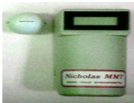
تصویر شماره ۴. Manual Muscle Test Nicholas

قبل از شروع مداخله شاخص های آماری هر یک از متغیرها در جدول شماره ۱ ثبت گردید. بعد از اتمام دوره مداخله و انجام ارزیابی نهایی میزان تغییر هر یک از متغیرها ثبت و در جدول شماره ۲ آورده شده است. آزمون T زوجی جهت تحلیل داده ها بعد از مداخله مورد استفاده قرار گرفت و نشان داد که تمام متغیرهای مورد بررسی بهبود معناداری ( P < 0.005 ) داشته اند که در جدول شماره ۳ اطلاعات مربوطه آورده شده است. این اطلاعات نشان می دهد که روش تمرینات مقاومتی پیشرونده توانسته قدرت را در عضلات ابدکتور و اکستانسور شانه، عضلات شرکت کننده در Pinch و Grip افزایش دهد و نهایتاً منجر به پیشرفت زبردستی شود (نمودار شماره ۱).