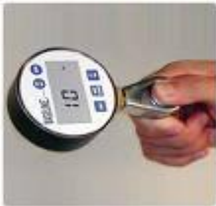
تصویر شماره ۲. Pinch Gauge