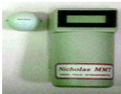
تصویر شماره ۴. Manual Muscle Test Nicholas

قبل از شروع مداخله شاخص های آماری هر یک از متغیرها در جدول شماره ۱ ثبت گردید. بعد از اتمام دوره مداخله و انجام ارزیابی نهایی میزان تغییر هر یک از متغیرها ثبت و در جدول شماره ۲ آورده شده است. آزمون T زوجی جهت تحلیل داده ها بعد از مداخله مورد استفاده قرار گرفت و نشان داد که تمام متغیرهای مورد بررسی بهبود معناداری ( P < 0.005 ) داشته اند که در جدول شماره ۳ اطلاعات مربوطه آورده شده است. این اطلاعات نشان می دهد که روش تمرینات مقاومتی پیشرونده توانسته قدرت را در عضلات ابدکتور و اکستانسور شانه، عضلات شرکت کننده در Pinch و Grip افزایش دهد و نهایتاً منجر به پیشرفت زبردستی شود (نمودار شماره ۱).