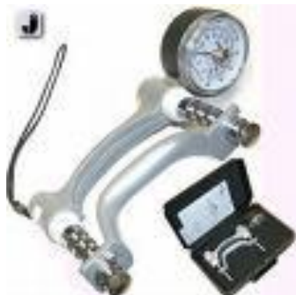
تصویر شماره ۳. Jamar Dynamometer

توجه به تهیه و حمل آسان، نحوه اجرای ساده آن برای بیماران همی پلژی بزرگسال بسیار مناسب بود(۱۴).