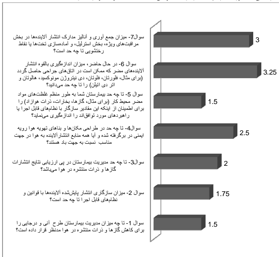
نمودار شماره 1. میانگین امتیاز داده شده به پرسش های پرسش نامه در رابطه با شرایط مدیریت انتشار آلاینده ها به هوا در بیمارستان های آموزشی

بخش های خاص بیمارستان ها که با مواد زائد خطرناک سروکار دارند با میانگین 4/25 به عنوان مهم ترین نقطه قوت معرفی شد، این در حالی بود که قوانین خاصی برای چگونگی ذخیره مواد زائد خطرناک وجود نداشت و عدم وجود برنامه ای مکتوب و دقیق برای حذف مواد زائد حاوی جیوه با میانگین 2/25 و عدم وجود معیارهای سنجش برای کاستن، حذف یا بهبود مدیریت مواد شیمیایی خطرناک و سمی قابل تجمع زیستی پایدار در بیمارستان های آموزشی با میانگین 2/5 به عنوان مهم ترین نقاط ضعف در این زمینه بود. در بخش ششم به چگونگی مدیریت آب در بیمارستان های آموزشی پرداخته شد. نتایج مشاهده ها و تکمیل پرسش نامه نشان داد که بالاترین امتیاز به بررسی منظم نظام های لوله کشی آب برای نشت با میانگین 3/75 تعلق گرفت که نشان دهنده ارزیابی ادواری مناسب این بخش از مدیریت است. در بخش هفتم و مدیریت فاضلاب، نتایج نشان داد که در تمام بیمارستان های مورد مطالعه آنالیزهای شیمیایی و میکروبی فاضلاب صورت نمی گیرد، به طوری که بررسی و نظارت بیمارستان های آموزشی بر فاضلاب بیمارستانی به طور منظم جهت سازگاری با قوانین