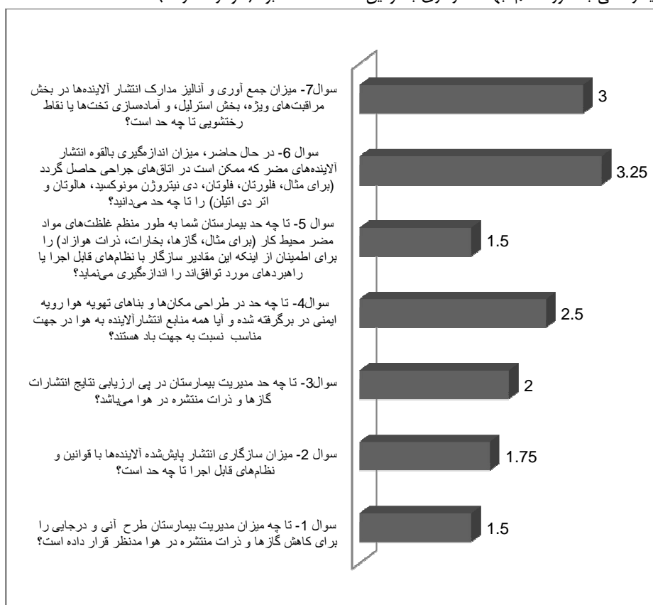
نمودار شماره 1. میانگین امتیاز داده شده به پرسش های پرسش نامه در رابطه با شرایط مدیریت انتشار آلاینده ها به هوا در بیمارستان های آموزشی

بخش های خاص بیمارستان ها که با مواد زائد خطرناک سروکار دارند با میانگین 4/25 به عنوان مهم ترین نقطه قوت معرفی شد، این در حالی بود که قوانین خاصی برای چگونگی ذخیره مواد زائد خطرناک وجود نداشت و عدم وجود برنامه ای مکتوب و دقیق برای حذف مواد زائد حاوی جیوه با میانگین 2/25 و عدم وجود معیارهای سنجش برای کاستن، حذف یا بهبود مدیریت مواد شیمیایی خطرناک و سمی قابل تجمع زیستی پایدار در بیمارستان های آموزشی با میانگین 2/5 به عنوان مهم ترین نقاط ضعف در این زمینه بود. در بخش ششم به چگونگی مدیریت آب در بیمارستان های آموزشی پرداخته شد. نتایج مشاهده ها و تکمیل پرسش نامه نشان داد که بالاترین امتیاز به بررسی منظم نظام های لوله کشی آب برای نشت با میانگین 3/75 تعلق گرفت که نشان دهنده ارزیابی ادواری مناسب این بخش از مدیریت است. در بخش هفتم و مدیریت فاضلاب، نتایج نشان داد که در تمام بیمارستان های مورد مطالعه آنالیزهای شیمیایی و میکروبی فاضلاب صورت نمی گیرد، به طوری که بررسی و نظارت بیمارستان های آموزشی بر فاضلاب بیمارستانی به طور منظم جهت سازگاری با قوانین