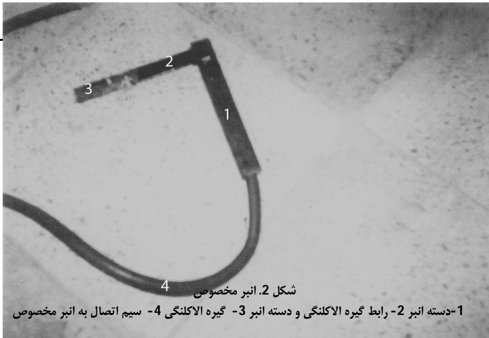
شکل 2. انبر مخصوص 1-دسته انبر 2- رابط گیره الاکلنگی و دسته انبر 3- گیره الاکلنگی 4- سیم اتصال به انبر مخصوص