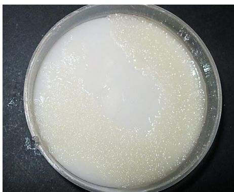
شکل 3. کلنی رشد کرده در محیط مانیتول آگار فاقد منبع نیتروژن