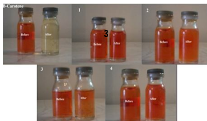
تصویر 3: بتاکاروتن؛ و بتاکاروتن در حضور جاذب های UV قبل و پس از 30 روز قرار گرفتن در معرض نور آفتاب (1=a, 2=b, 3=c, 4=d)