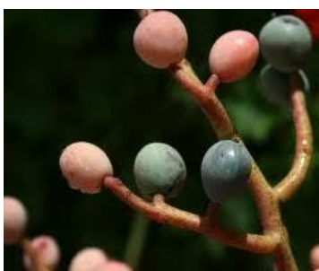
شکل شماره ۲. میوه بنه

است اما پوسته آن دارای رنگ سرخ اخراپی است که ترش مزه است. (شکل شماره ۲) آخرین مرحله، میوه رسیده بنه است که هسته آن کاملاً سخت شده و رنگ پوسته آن نیز در محدوده رنگی سبز تا سبز متمایل به آبی است. (شکل شماره ۲) بنه کاملاً رسیده همان بنه که لهوهن است