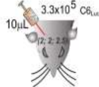
تصویر موقعیت تزریق سلول‌های سرطانی

mm anteroposterior, 2.0 mm laterolateral, and a depth of 2.5 mm 2.0