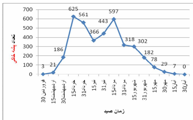
نمودار شماره 1. فعالیت ماهانه فلبوتوموس پاپاتاسی به تفکیک ماه های مختلف در منطقه قنوات استان قم، سال 1391