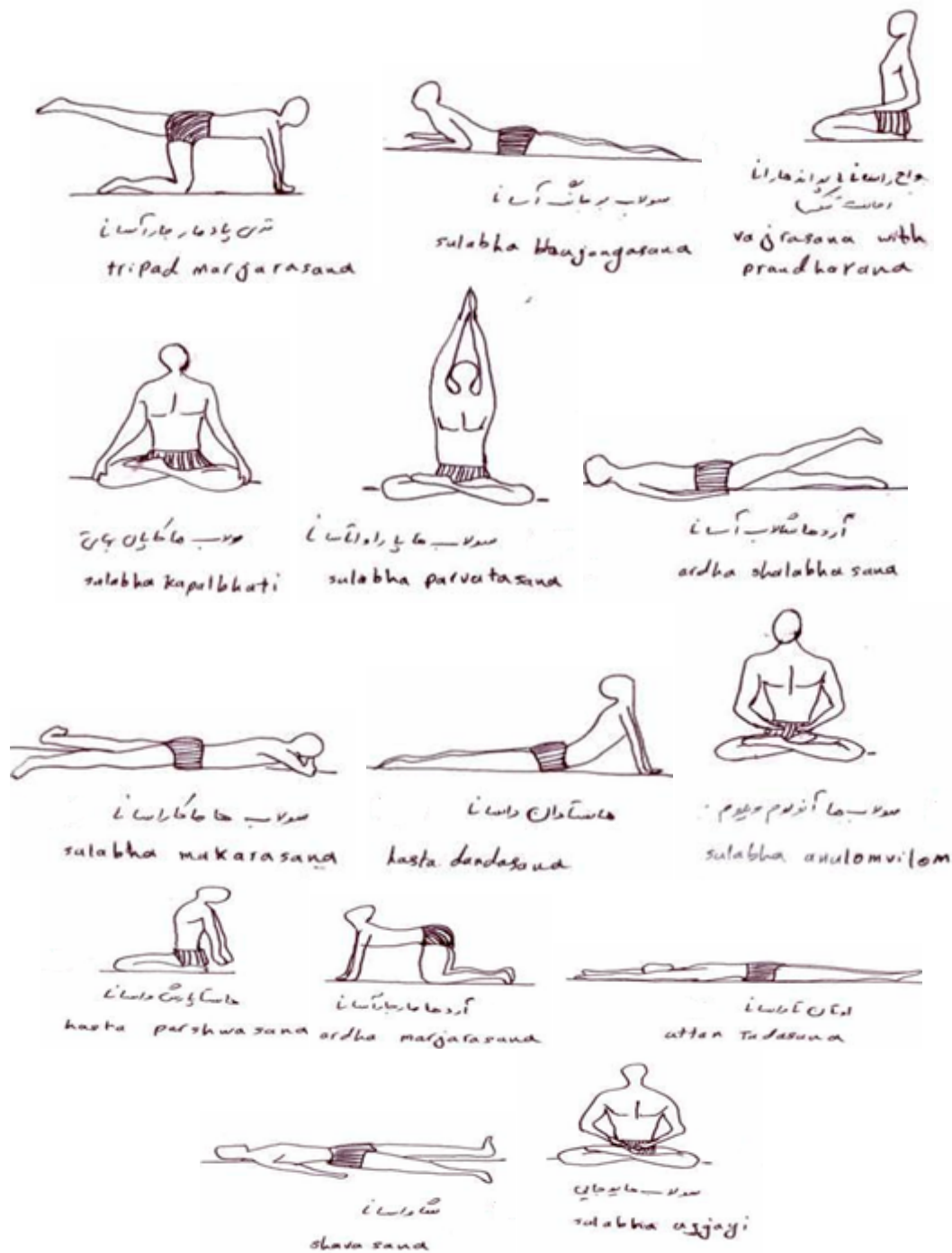
شکل شماره ۲. تصاویر ۱۴ تمرین اختصاصی یوگا

داده ها در محیط نرم افزار SPSS v.17 تجزیه و تحلیل گردید. نرمال بودن توزیع با آزمون کولموگروف اسمیرنوو بررسی شد. برای برابری واریانس ها از آزمون لوین استفاده شد. برای داده های با