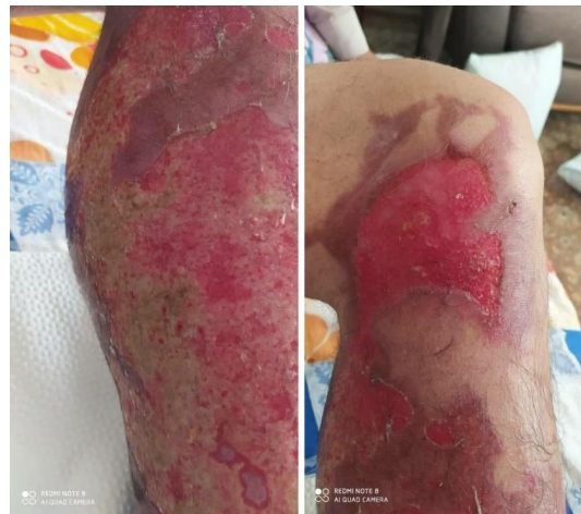
شکل شماره ۱. نمونه‌ای از بیمار دارای زخم سوختگی با عفونت ناشی از Escherichia coli مقاوم به آنتی‌بیوتیک

بررسی الگوی مقاومت آنتی‌بیوتیکی در بیماران سوختگی: در این تحقیق، بررسی فراوانی باکتری‌های