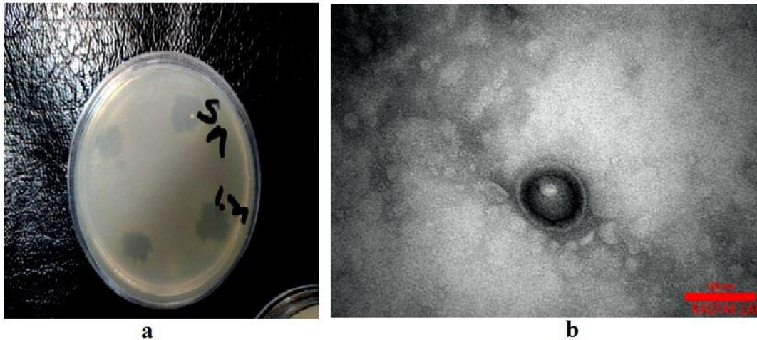
شکل شماره ۴. (a) نتیجه تست نقطه‌ای و بررسی حساسیت باکتری Escherichia coli فاژ PφBw-Ec01 (b) تصویر TEM از باکتریوفاژ PφBw-Ec01 متعلق به خانواده Cystoviridae (با میزان تقریبی 10 \pm 80 نانومتر)

باکتری Escherichia coli مقاوم به شکل کاملاً اختصاصی است و این مسئله بسیار قابل توجه است؛ بنابراین، با توجه به محدود شدن طیف بهره‌برداری از آنتی‌بیوتیک‌ها به علت مقاومت دارویی گسترده طی سال‌های اخیر، ویروس‌های باکتریایی (باکتریوفاژها) با توجه به ماهیت طبیعی بودنشان و ویژگی‌های خاصی که دارند، می‌توانند به‌عنوان یکی از مطلوب‌ترین و مناسب‌ترین گزینه‌های موجود برای جایگزینی آنتی‌بیوتیک‌های مختلف در نظر گرفته شوند؛ همچنین فاژها می‌توانند با محصولات ارزان‌قیمت وارد جوامع گردند و پیشگیری و درمان عفونت‌های جدی بیمارستانی را دست بگیرند (۲۶). باکتری Escherichia coli طی ارزیابی مقاومت و حساسیت به آنتی‌بیوتیک‌های منتخب، با استفاده از روش انتشار دیسک در آگار Kirby-Bauer مورد تشخیص قرار گرفت. فاژ ایزوله‌شده از تصفیه‌خانه شمال اصفهان، به‌عنوان یکی از مؤثرترین فاژ علیه این باکتری گزینش شد و مطالعات بیشتر مانند بررسی مورفولوژی فاژها توسط TEM و بررسی محدوده‌ی میزان روی این باکتریوفاژ انجام گردید. فاژ اختصاصی PφBw-Ec01 به‌طور چشمگیری قادر به عفونی کردن باکتری Escherichia coli مقاوم بود. TEM نشان داد که فاژ ایزوله‌شده ویروس بدون دم و dsRNA و متعلق به خانواده Cystoviridae با پروتوتایپ φ۶ است. فاژ لیتیک