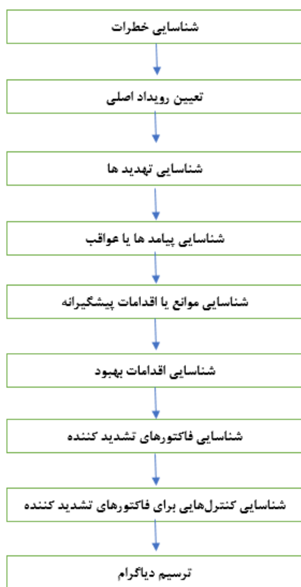
شکل شماره ۲. مراحل اجرای روش پایبونی

ناشی از آن‌ها به کار می‌رود (۱۲). در این روش، سه مؤلفه اصلی شدت پیامد، احتمال وقوع پیامد و احتمال کشف پیامد وجود دارد. شدت پیامد به معنای میزان آسیب پیامد