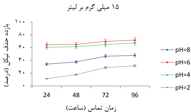
نمودار شماره ۲. اثر زمان تماس و pH های مختلف بر بازده حذف نیکل (II) با سویه Micrococcus luteus SEHD031RS در غلظت ۱۵ میلی گرم بر لیتر بر حسب درصد (سرعت اختلاط: ۲۰۰ دور بر دقیقه، دمای محیط ۲۵ درجه سانتی گراد)