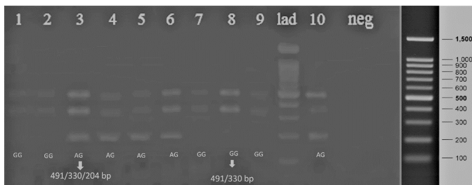
شکل شماره ۳. الکتروفورز محصول Arms PCR نمونه های سالم بر روی ژل ۲ درصد ۱-۱۰ نمونه های سالم؛ Lad: نشانگر وزن مولکولی DNA ۱۰۰ bp (شرکت SinaClon)؛ Neg: کنترل منفی

قرار گرفت که خلاصه نتایج حاصل از بررسی ژنوتیپ ها در جدول شماره ۲ ارائه شده است.