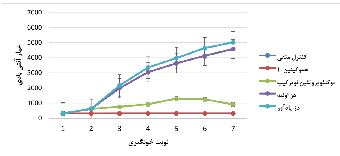
نمودار شماره ۲. القاء پاسخ ایمنی همورال در موش های ایمن شده با نوکلئوپروتئین نوترکیب ویروس آنفلوانزا و یاور هموکینین-۱. یکنواختی افزایش عبار آنتی بادی اختصاصی در طول دوره آزمایش برای هر دو گروه تیمار که پروتئین و یاور را در دز اولیه و دز یادآور دریافت کرده بودند مشاهده شد.