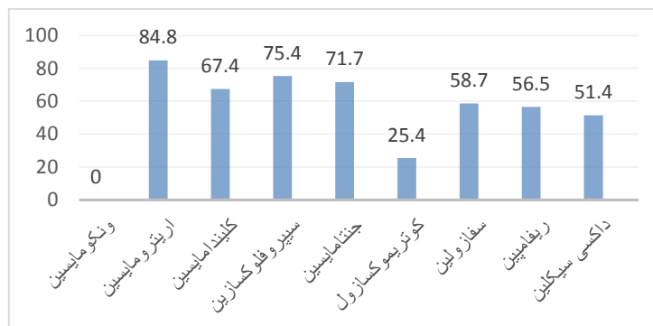
نمودار شماره ۱. درصد مقاومت ایزوله های استافیلوکوک مقاوم به متی سیلین در برابر آنتی بیوتیک های مورد آزمایش

در این بررسی که از تیر ۱۳۹۵ تا فروردین ماه سال ۱۳۹۶ انجام شد، ۱۷۴ ایزوله استافیلوکوک اورئوس مقاوم به متی سیلین از نمونه های مختلف بالینی نظیر: خون (۳/۱ درصد)، خلط (۶/۲ درصد)، اگزذای تراشه (۳۱/۹ درصد)، برونش (۱۵/۵ درصد)، پلور (۷/۷ درصد)، کتتر (۸ درصد) ادرار (۱۲ درصد) و زخم (۱۸/۲ درصد) جدا شده از بیمارستان های امام حسین (۲۰/۷ درصد)، لقمان حکیم (۵۰/۵ درصد) و پارس (۲۸/۸ درصد) تهران مورد