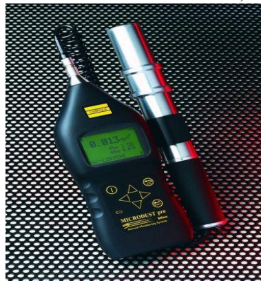
شکل ۱: Casella's. Microdust pro Particulate Monitor

استفاده شد (شکل ۱) که قادر است تراکم کل ذرات معلق گرد و غبار (TSP) در غلظت های بین 1\mu\text{g}/\text{m}^3 - 2500\text{mg}/\text{m}^3 را مشخص کند.