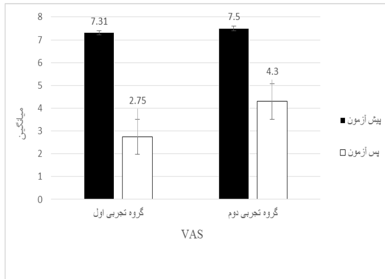
نمودار ۱. نمرات درد دو گروه قبل و بعد از تمرینات

جدول ۳ نتایج حاصل از آزمون t مستقل و t وابسته مربوط به درد و عملکرد را نشان می دهد. همان طور که مشاهده می شود هر دو روش تمرینی تأثیر معنی داری بر روی میزان درد دارند، یعنی بین میانگین درد قبل از درمان و بعد از درمان دو گروه اختلاف معنی داری وجود دارد (p=۰/۰۰۱). مقایسه بین گروهی نیز نشان می دهد که در پیش آزمون بین میانگین نمرات درد گروه ها اختلاف معنی داری وجود ندارد (P=۰/۱۹)، در حالی که در پس آزمون بین میانگین درد گروه ها اختلاف معنی داری وجود دارد (P=۰/۰۰۳)، (t=۳/۶۴).