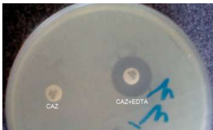
تصویر شماره ۱. روش فنوتیپی تشخیص سویه های مولد MBL با استفاده از دیسک ترکیبی

سویه (۱۵ درصد) به ایمی پنم، ۱۴ سویه (۲۳/۳ درصد) به پپیراسیلین-تازوباکتام و ۱۶ سویه (۲۶/۶ درصد) به سفنازیدیم مقاوم هستند. از مجموع ۶۰ نمونه مورد مطالعه، ۱۷ سویه (۲۸/۳ درصد) نمونه با روش دیسک دیفیوژن به سفنازیدیم غیر حساس (مقاوم و نیمه مقاوم) بودند که تمامی این ۱۷ نمونه با روش تائیدی به عنوان مولد MBL تشخیص داده شدند (تصویر شماره ۱).