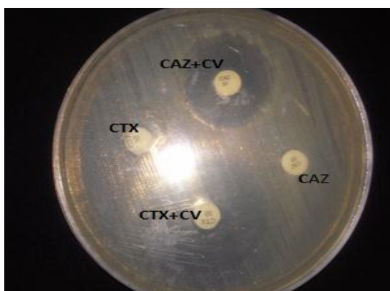
تصویر شماره ۱. تست تاییدی فنوتیپی جهت شناسایی سویه های اشریشیاکلی ESBL مثبت

در این مطالعه تعداد ۱۰۰ ایزوله باکتری اشریشیاکلی از نمونه عفونت های ادراری (بیمارستان امام خمینی و مصطفی خمینی و ۵ آزمایشگاه طبی در سطح شهر ایلام) جمع آوری و با تست های بیوشیمیایی تایید شدند. تست آنتی بیوگرام بر روی سویه های اشریشیاکلی خالص شده با روش انتشار دیسک (Kirby-Bauer) طبق توصیه CLSI نسبت به ۱۴ آنتی بیوتیک (کارخانه پاتن طب استفاده گردید) شامل آنتی بیوتیک های سفالوتین ۳۰ میکروگرم (CF)، سفتریاکسون ۳۰ میکروگرم (CRO)، سفنوتاکسیم ۳۰ میکروگرم (CTX)، پنی سیلین ۱۰ میکروگرم (P)، سفازولین ۳۰ میکروگرم (CZ)، سفنازیدیم ۳۰ میکروگرم (CAZ)، سفالکسین ۳۰ میکروگرم (CN)، سیپروفلوکساسین ۵ میکروگرم (CP)، تریکومتاکسازول ۳۰ میکروگرم (SXT)، جنتامایسین ۱۰ میکروگرم (GM)، اریترومایسین ۱۵ میکروگرم (ERY)، ایمی پنم ۱۰ میکروگرم (IPM)، آمیکاسین ۳۰ میکروگرم (AN)، آموکسی سیلین ۳۰ میکروگرم (AM) انجام گردید (کارخانه پاتن طب استفاده گردید) (۱۸). از سویه