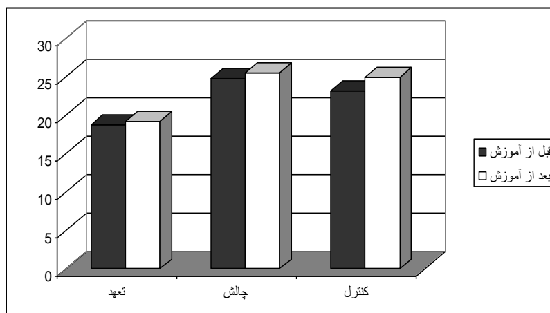
نمودار شماره ۲. توزیع میانگین مولفه‌های سخت‌رویی را قبل و بعد از آموزش

رویی روی مولفه های فرسودگی شغلی کارکنان در مقیاس فراوانی و شدت بررسی می شود که نتایج آن در جدول شماره ۲ ارائه شده است.