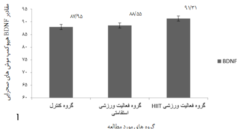
شکل شماره ۲. تغییرات پروتئین BDNF هیپوکمپ موش های صحرائی نر بالغ در گروه های مورد مطالعه