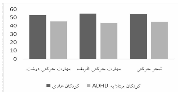
نمودار شماره ۱. مقایسه دو گروه دانش آموزان عادی و دانش آموزان مبتلا به ADHD در مهارت های گوناگون