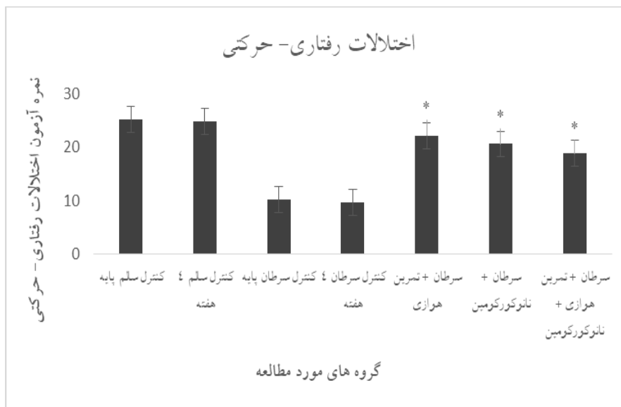
شکل شماره ۲. توزیع نمره آزمون اختلالات رفتاری-حرکتی در گروه‌های مختلف. * تفاوت معنادار نسبت به گروه کنترل سرطان ۴ هفته و سرطان پایه

مکمل نانو کورکومین، در نمره آزمون رفتاری-حرکتی مشاهده شد ( P=0.001 ) (جدول شماره ۳).